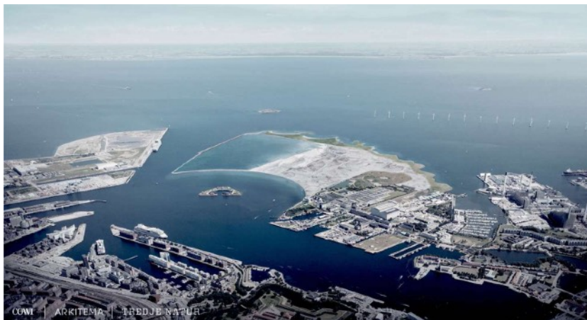
Illustration: COWI m.fl.

Sådan kan den nye bydel Lynetteholmen komme til at se ud. Bebyggelsen af den kunstige halvø ventes dog først at gå i gang i 2035.