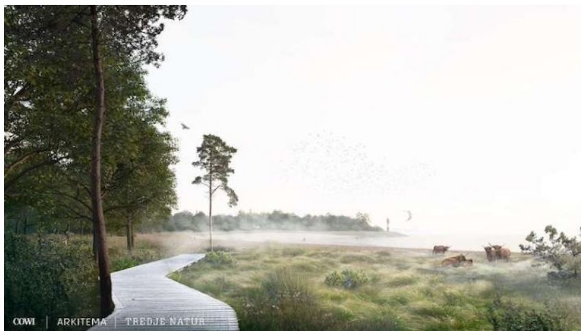
Illustration: COWI m.fl.

Får - eller som her højlandskvæg - kan vise sig at blive de eneste beboere på Lynetteholm.