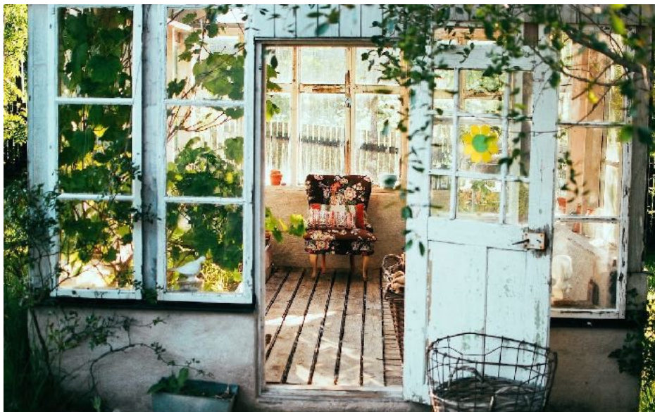
Gamle vinduer og døre kan få nyt liv i mange sammenhænge.

Skal du have nyt køkken, vinduer eller døre i dit sommerhus? Så genbrug de gamle materialer i have eller skur, f.eks. til et nemt udekøkken, et højbed eller en solskærm. Få gode råd til genbrug her .