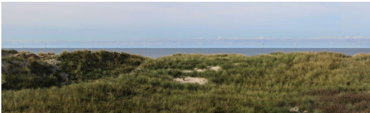
Eksempel på billeder fra visualiseringsrapporten med synligheden af møller i en afstand af 9 km nedtonet.

Afsnittet om landskab rummer også visualiseringer fra udvalgte punkter. Vi bemærker, at man tilsyneladende bevidst har prøvet at neddæmpe skarpheden – sikkert ud fra, at solen ikke skinner hver dag. Fotos giver generelt ikke en naturtro gengivelse af virkeligheden.