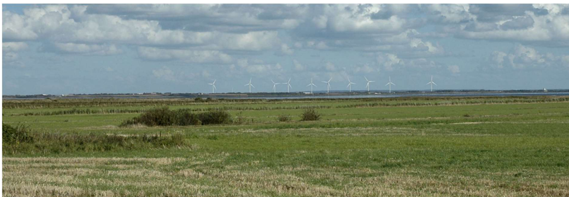
Møller ved Vonå. - Eksisterende 125m høje møller fotograferet i en afstand af 9 km. VHS-møller er 193 m høje.

Vi anerkender, at det er en svær og i virkeligheden umulig opgave, at "pakke" 193 m høje møller ind i en beskrivelse, der nedtoner deres tilstedeværelse. Man undlader at udarbejde referencemateriale af synligheden af eksisterende møllerparker i nærområdet.